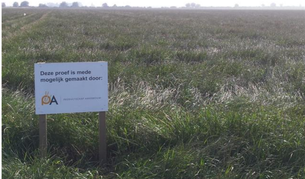
Op 20 juni waren de legeringsverschillen klein

In 2012 is het onderzoek vervolgd om hierover meer duidelijkheid te krijgen. Ook is een nieuwe groeiregulator in de proef opgenomen en is nagegaan of er interactie met de groeistof MCPA optreedt. In 2012 verliep de legering anders dan "normale" jaren en was het effect van behandeling tegen legering veel kleiner. Actirob had dit jaar geen toegevoegde waarde en er was pas sprake van een doseringseffect van Moddus als deze terugging naar 0,4 l/ha. Een nieuwe groeiregulator werkte op hetzelfde niveau als Moddus. Er was geen sprake van interactie tussen Moddus en MCPA, hoewel MCPA de legering wel iets verminderde.