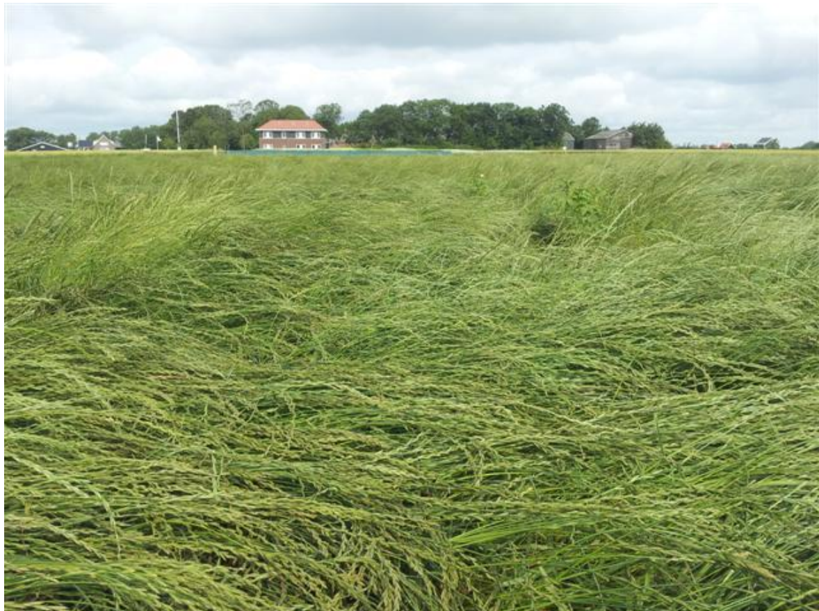
Het gewas is op 10 juli iets aan het legeren.